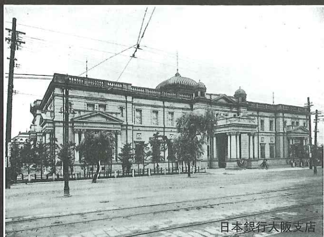
日本銀行大阪支店