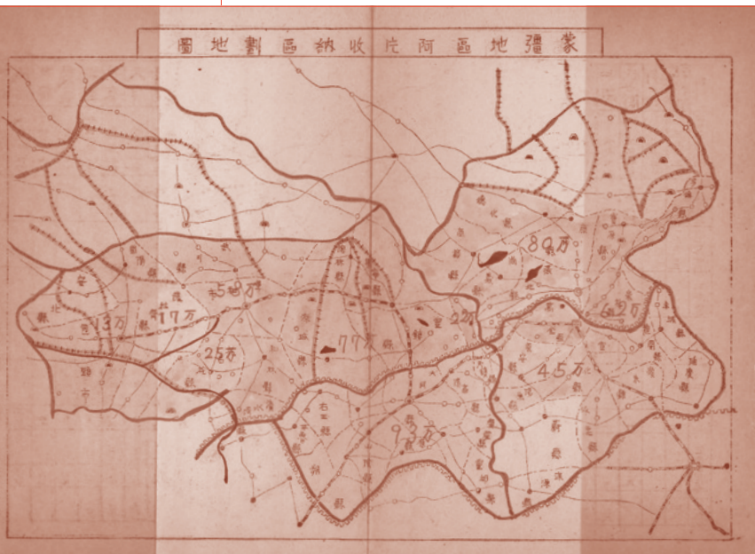
▶第2冊 資料41より「満洲地区阿片収納区画地図」

★戦時下の北支・満洲の漢薬調査資料を収録。蒙疆地区の阿片の歴史、生産、流通などにつき詳述された資料も含む。