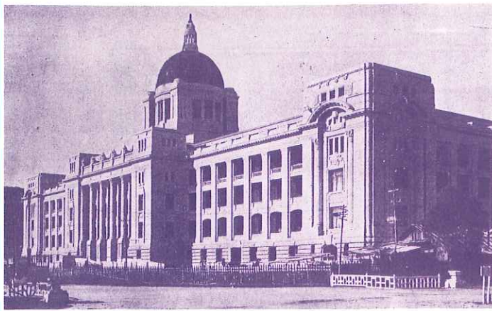
写真は朝鮮總督府の施政15周年を期して新築された庁舎。『朝鮮』（朝鮮總督府発行、大正14年10月号）の巻頭口絵写真より。この建物は、1997年韓国政府により解体・撤去された。

●復刻の辞——朝鮮總督府が、帝國議會のために作成した『帝國議會説明資料』は、現在その大部分が散佚・消却され、その全容を把握することは不可能である。