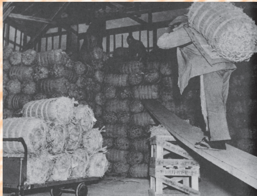
玄米が積み上げられる倉庫の様子『写真週報』1941年3月より。

産業組合中央会「皇国食糧充足計画要綱」1943年ごろ（資料10） 「天分調査」「町村一家体制ノ確立」などが唱えられ、報徳運動と連動するかたちで構想された計画だが、結局は日の目をみずに埋もれた施策だったと考えられる。後者については、戦時スローガンのひとつとして全国の町村に膾炙した。