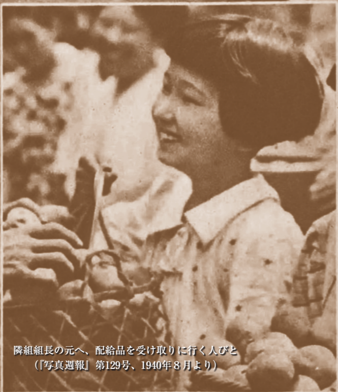
隣組組長の元へ、配給品を受け取りに行く人びと (『写真週報』第129号、1940年8月より)

●資料提供—一般社団法人家の光協会 ●定価—30,800円(本体28,000円+税10%) ●体裁—B5判・上製・総464頁 ISBN978-4-8350-6886-2