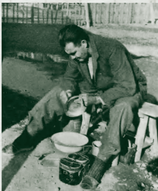
極寒の奉天俘虜収容所で、捕虜たちはどのような扱いを受けていたのか？ (写真は「写真週報」1942年12月16日号掲載の、東京で撮影されたアメリカ兵捕虜の様子)